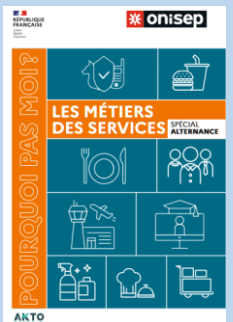
27 Secteurs d'activités décrits : de l'hôtellerie et des restaurations à la propreté, en passant par la sécurité privée, le travail temporaire, les organismes de formation, le transport aérien ou le commerce de gros..

Début Novembre 2023 > Janvier 2024 - Je m'informe et découvre les formations