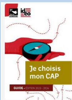
Je choisis mon CAP Guide 2023-2024